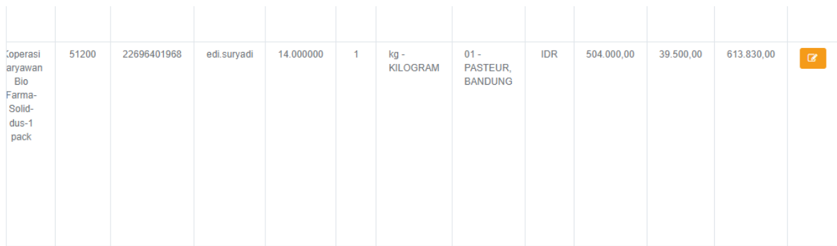
Gambar 6 Tampilan Ajuan Edit Item amandemen

Vendor memilih item perikatan yang akan diinputkan kategori amandemen, Klik tombol Edit