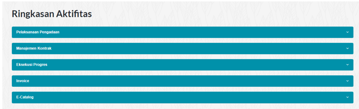
Gambar 1 Tampilan Awal Aplikasi